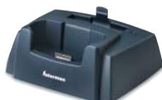
Desktop Dock Ethernet

Der 2D-Imager ist zusätzlich in der Lage, Schwarz-Weiß-Fotografien für Anwendungen wie z.B. Liefernachweise, Marktbefragungen und Außendienst-Kontrollen, zu scannen. Linear 1D und PDF 417 Laser Scanner vervollständigen das Scanner-Angebot.