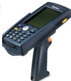
700 Scan Handle