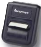
PB 20-Bluetooth Printer 2.5"